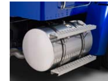
Des réservoirs à carburant en aluminium poli, construits par Kenworth.

Votre Kenworth de classe moyenne est disponible avec des options spécifiques à la tâche et à l'apparence. En voici quelques-unes.