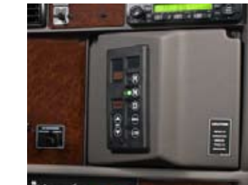
Un tableau de bord aux contrôles faciles à opérer pour les transmissions automatisées Eaton et automatiques Allison.