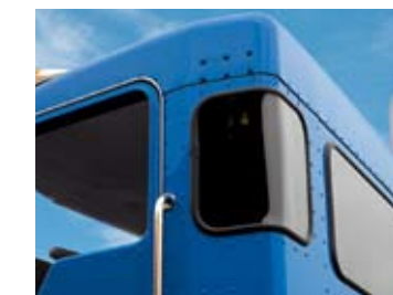
En plus de la fenêtre d'observation standard dans la portière du passager, des fenêtres d'angles dans la cabine sont disponibles en option afin d'aider à améliorer la visibilité dans les espaces restreints.