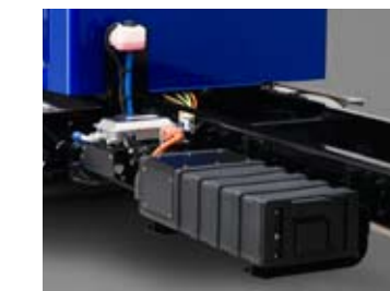
Un système hybride Eaton avec batterie à haute puissance au lithium ion pour le contrôle de l'économie de carburant.