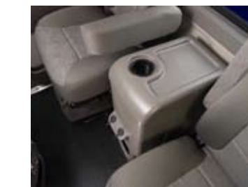
Une console centrale optionnelle avec deux bornes d'alimentation, un porte-gobelet et de l'espace de rangement utile.