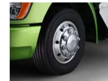
Des roues en aluminium poli.