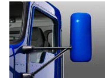
Des rétroviseurs aérodynamiques chauffants et ajustables électriquement.