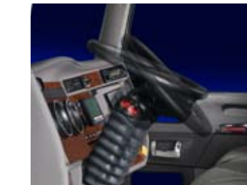
Une colonne de direction télescopique inclinable.